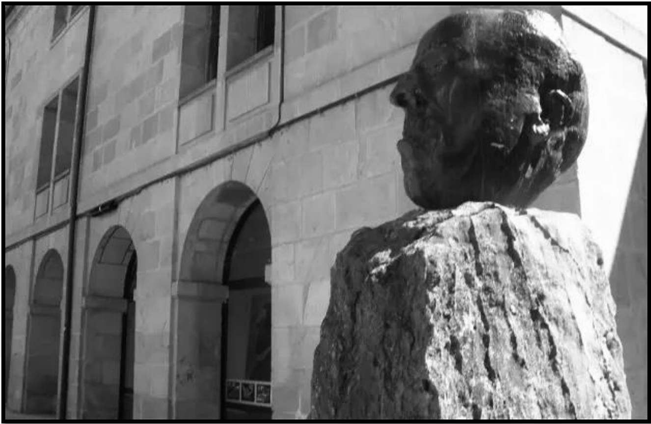
Estatua cabeza Antonio Machado

“Corazón está donde ha nacido, no a la vida, al amor, cerca del Duero”